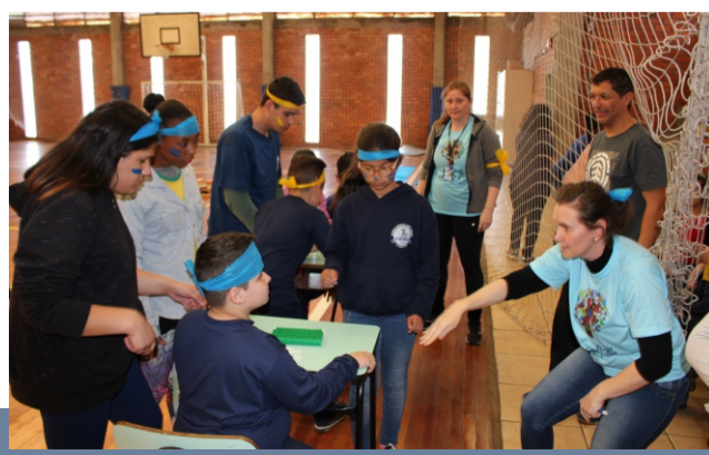
Semana do Surdo. Comemorações pelo seu Dia e Aniversário dos 64 anos da Escola Frei Pacifico