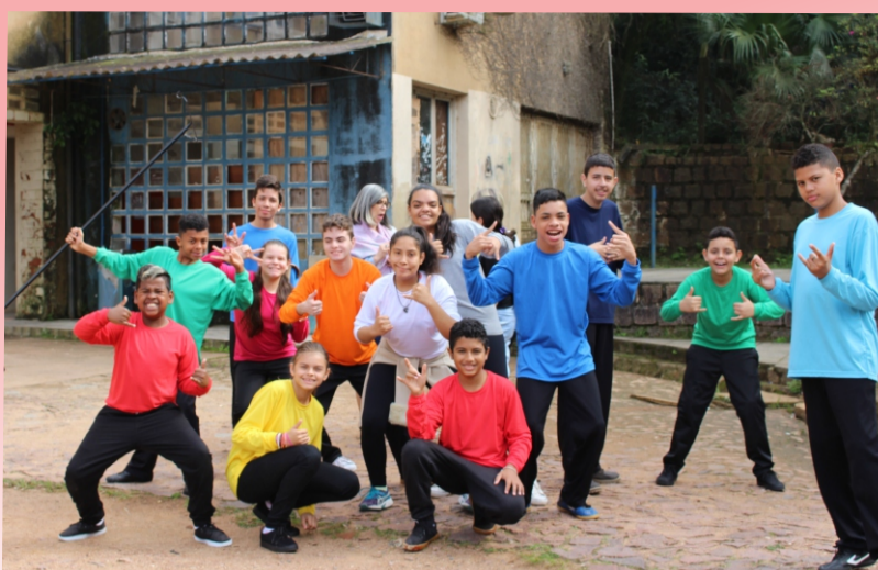
Na Escola GEMA