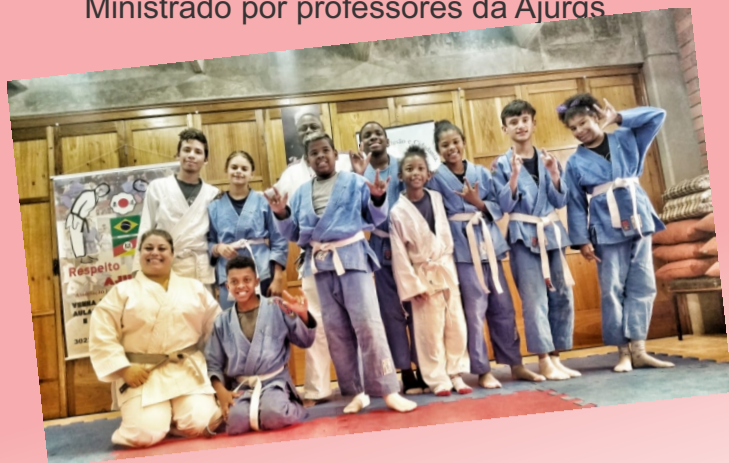
Na Escola Frei Pacífico