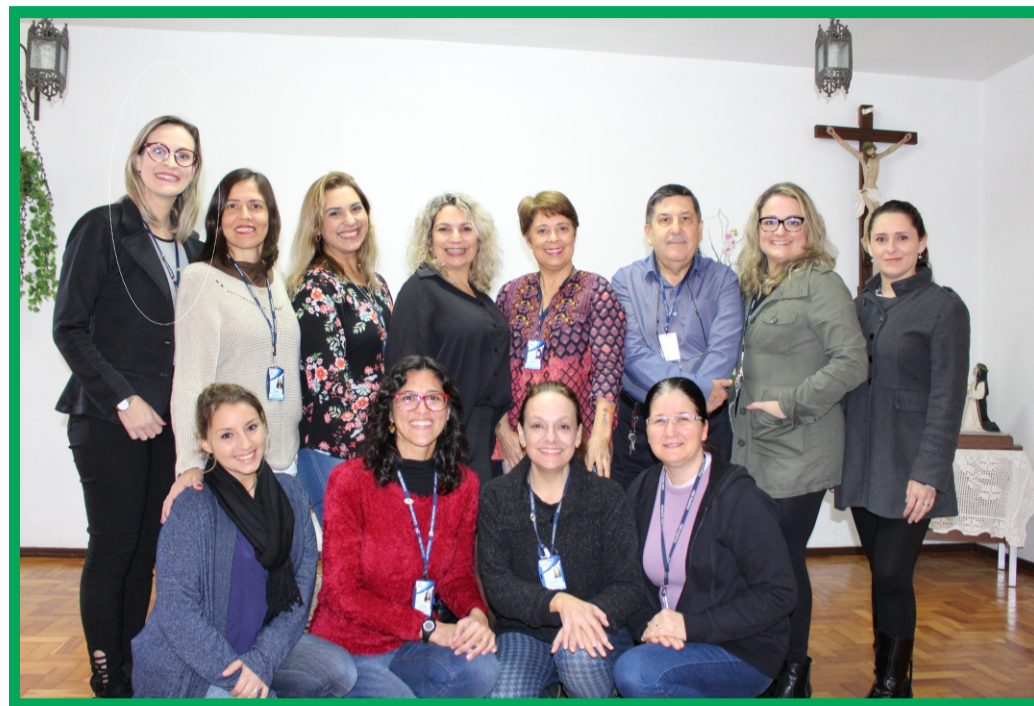
Equipe da Clínica

Hoje a Clínica Especializada em Comunicação é mantida pela Associação Cruzeiras de São Francisco (ACSF) e possui convênio com a Fundação de Assistência Social e Cidadania (FASC). São desen-