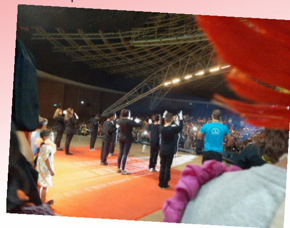
No Araújo Viana