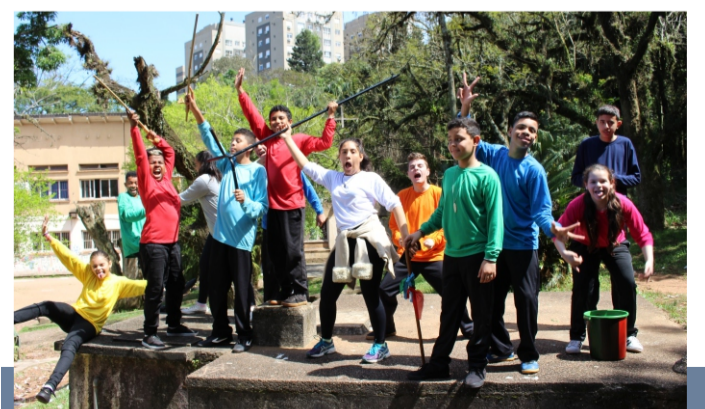
Oficina de Teatro e demais atividades do Centro Social Frei Pacifico